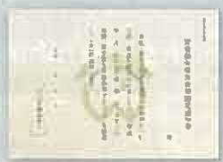
(認定通知書イメージ)