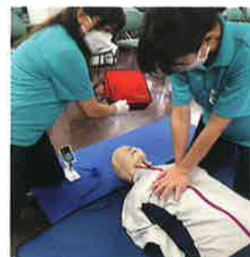
酸欠作業主任者実技講習