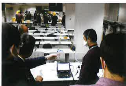
マスクフィットテスト実施者実技講習