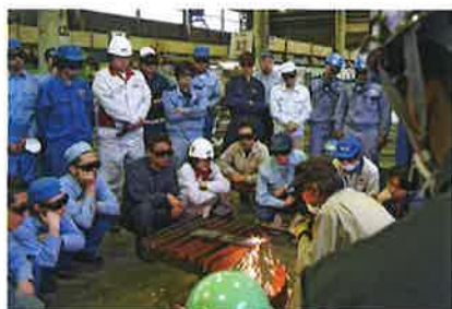
ガス溶接実技講習