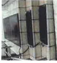
＜ヒートマットの設置例＞

職場内の労働者が転倒の危険を感じた場所の情報を収集し、労働者への教育の機会に伝えるようにしましょう。また、作業に適した履物、雪道や凍った路面上での歩き方を教育しましょう。