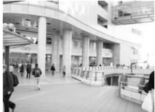
②マルイ正面手前の階段で2階デッキから地上に下りて、そのまま進み下さい。