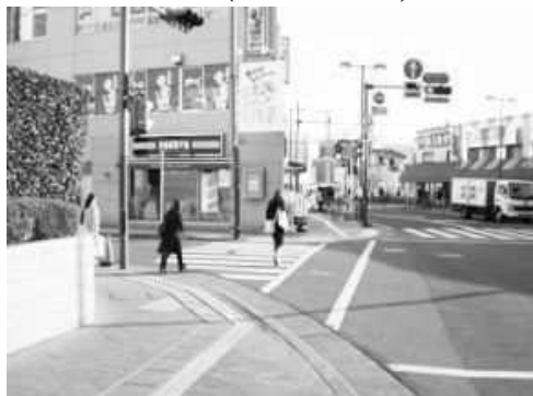
③みずほ信託銀行の前を通り、マルイビルの角、ドトールコーヒーの手前、合同庁舎入口交差点を左折して下さい。