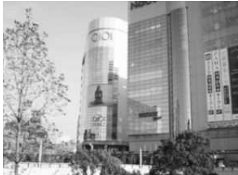
①東急溝の口駅東口、又はJR武蔵溝ノ口駅北口に出て、マルイファミリー溝口店(ノクティプラザ2)方面へ。