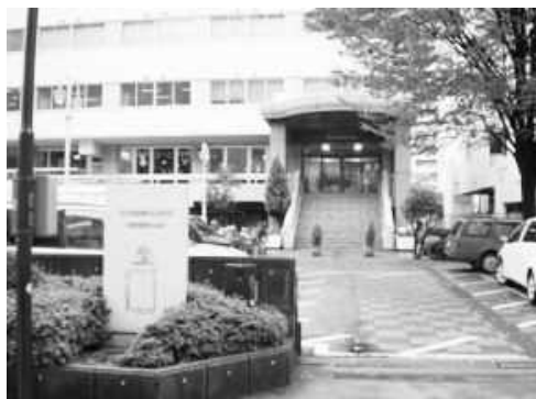
⑤JAセレサ川崎の隣(先)のビルが川崎市生活文化会館 てくのかわさきです。青い入口が特徴です。