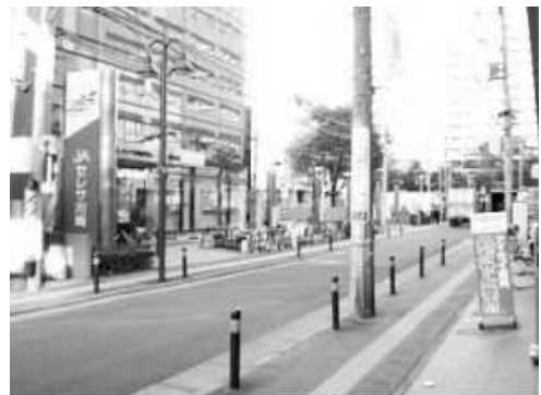
④マルイの角を左折して150m直進すると、左側にJAセレサ川崎(農協)があります。