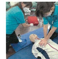
酸欠作業主任者実技講習