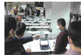
マスクフィットテスト実施者実技講習