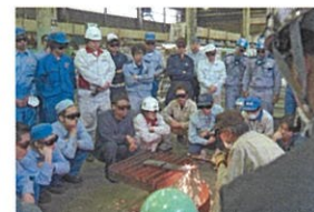
ガス溶接実技講習