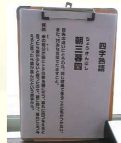
社員へメッセージ