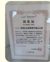
健康経営優良法人 2023取得