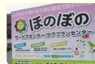
地域の人が利用・交流できる CAFE併設