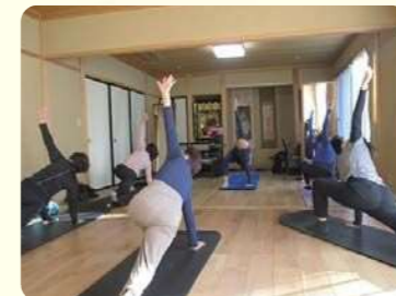
理事長が講師！ピラティス教室（藤野）