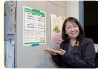
健康応援かべ新聞掲示中