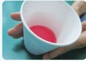
お手製しそジュース!