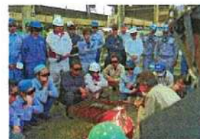
ガス溶接実技講習