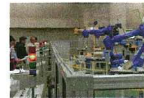
産業用ロボット実技講習