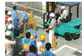
フォークリフト実技講習