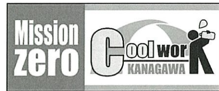
労働者配布用チェックリスト