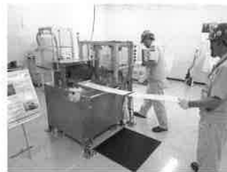
危険体感機(ロール巻き込まれ)▶

実際に製作所内で発生、もしくは発生リスクのある労働災害について、どういった危険があるのかを模擬体感させることで安全意識の向上を図るものです。ロール巻き込まれ、粉塵爆発、有機溶剤の静電放電火災など16種の体感機を用意しています。現在は派遣社員を含め従業員全員への体感を進めており、安全レベルの向上に役立っています。