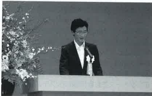
大屋監督署長挨拶