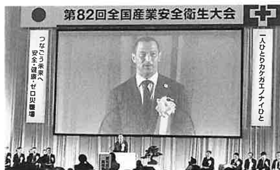
室伏スポーツ庁長官祝辞