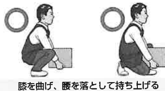
膝を曲げ、腰を落として持ち上げる