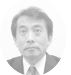
（公）神奈川労働安全衛生協会 横須賀支部

「新年を迎えて」 新年明けましておめでとうございます。本年もどうぞよろしくお願ひいたします。 横須賀支部並びに会員事業場の皆様におかれましては、旧年中、労働基準行政の推進に御理解と御協力を賜り、厚く御礼申し上げます。 さて本年の四月から、時間外労働の上限規制の適用が猶予されていた自動車運転者、建設事業、医師に上限規制が適用になります。これらの事業・業務における上限規制の適用は、会員事業場の皆様の事業活動に大きな影響をもたらすことになると思います。今まで