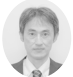
横須賀労働基準監督署