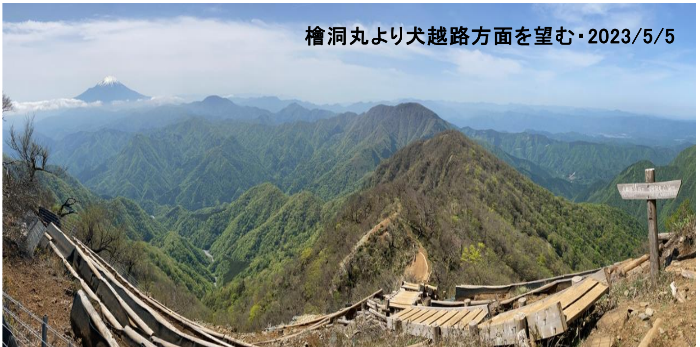
檜洞丸より犬越路方面を望む・2023/5/5

これから、暑くなります。暑さに体が慣れていないこの季節、熱中症に要注意、体調管理にお気を付けください。