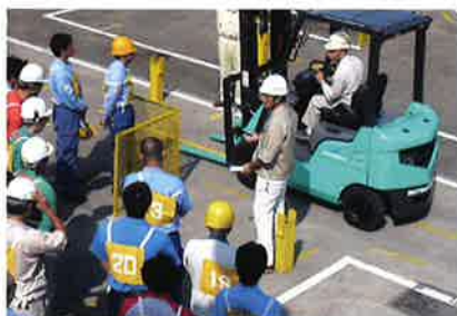
フォークリフト実技講習