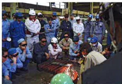
ガス溶接実技講習