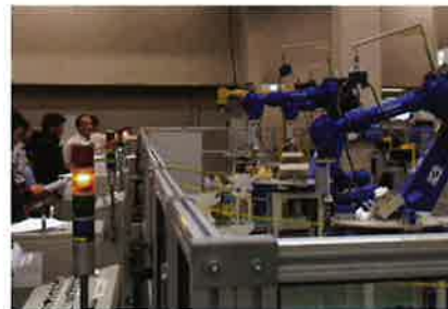
産業用ロボット実技講習