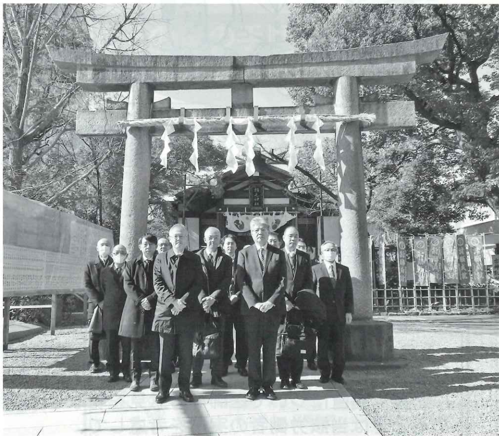
稲毛神社での安全衛生祈願祭

稲毛神社は、JR川崎駅から徒歩10分程の国道15号線沿いにあり、人生の試練困難や病気に打ち勝ち、和を与える由緒ある神社として有名です。創建の年代は明らかで